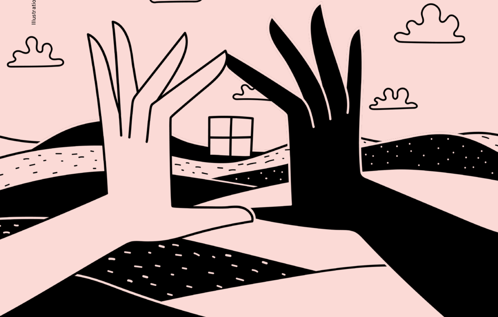
Illustration: Jont Meyer/Wildfox, Running