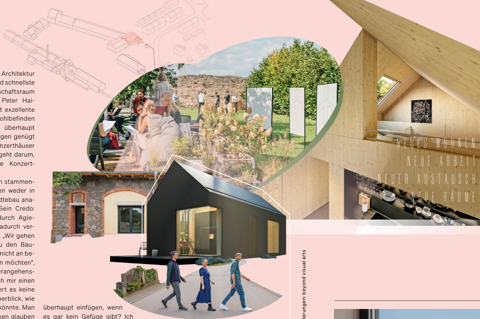
Fotos Friederike Tröndle, Studio Bowie, Daniel Zenker, Pläne und Isometrien: Hütten & Paläste, Visualisierungen: beyond visual arts

Macher mit Idealen und Ideen Initiativen wie Neue Höfe oder Syndikat Walden, Studios wie Hütten & Paläste oder Peter Haimerl zeigen Wege, den ländlichen Raum neu zu denken